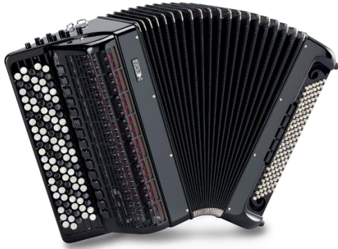
Slika 7: Moderna koncertna harmonika

Danas je harmonika jedan od najpopularnijih i najraširenijih instrumenata. Zbog bogatstva zvuka kojim je moguće dočarati široku paletu emocija, od veselja do tuge, harmonika je osvojila ljubav slušatelja diljem svijeta. Postoje brojne tvornice koje se bave isključivo izradom harmonika: u Europi je duga tradicija izrade harmonika prisutna u Njemačkoj (marke Horch, Hohner, Weltmeister, Barcarole, Firotti ) te naročito u Italiji (marke Scandalli, Pignini, Victoria, Bugari, ZeroSette, Borsini ). Harmonika se u velikim količinama proizvodi također u SAD-u, Rusiji (marke Jupiter, Tula accordion, AKKO ) i Kini.