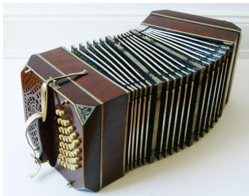
Slika 6: Bandoneon

Glavna razlika ranih varijanti i današnje, moderne harmonike jest u držanju instrumenta. Stariji modeli nisu imali remene koji omogućavaju da se harmonika drži uz tijelo, nego su se pridržavale prstima lijeve i desne ruke (najčešće palcem te četvrtim i petim prstom) pa su i izvođačke sposobnosti na takvom instrumentu bile vrlo skromne jer se najčešće sviralo samo sa po dva prsta desne i lijeve ruke. Velika razlika je bila i u tome što su rane harmonike (kao na primjer bandoneon) prilikom otvaranja mijeha proizvodile jedan ton (npr. ton c), a prilikom zatvaranja mijeha drugi ton (ton d).