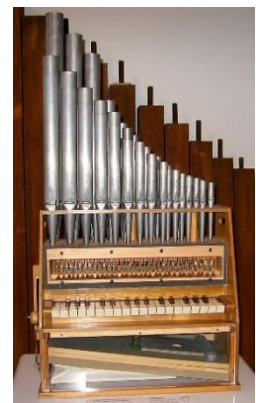
Slika 2: Portativ

Portativ je bio prijenosni instrument iz 12. i 13. st. kojeg je svirač držao na koljenima ili nosio. Sastojao se od kutije u obliku prizme u koju su bili usađeni jezičci poredani po duljini. Maleni mijeh je svirač pokretao lijevom rukom, a desnom rukom bi pritiskao tipke te na taj način proizvodio tonove.