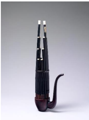
Slika 1: Šeng

Sastoji se od tri dijela: to su desna strana sa tipkama ili dugmićima, mijeh i lijeva ili basna strana. Harmonika je instrument koji pripada aerofonoj skupini instrumenata, odnosno instrumentima kod kojih se ton dobiva strujanjem zraka. Istovremenim pritiskom na tipku ili dugmić i povlačenjem mijeha, strujanje zraka uzrokuje titranje metalnih jezičaka koji na taj način proizvode ton. Registri koji se nalaze na obje strane dodatno omogućuju sviranje raznih tonskih visina kao i kombinaciju različite boje tonova. U ovom članku prikazat će se kratki povijesni razvoj harmonike, od njenih najranijih dana pa sve do danas.