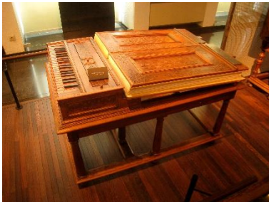
Slika 3: Regal

Regal je bio instrument koji se sastojao od dva mijeha. Mjehovi su upuhivali zrak u zračnice u kojima su se nalazili mjedeni piskovi koji su stvarali tonove pritiskom na tipke. Regal se svirao objema rukama, a uz svirača bio je potreban i pomoćnik koji je bio zadužen za upuhivanje zraka pomoću mjehova. Svoju najrašireniju upotrebu našao je kao prateći instrument pjevača madrigala između 15. i 18. stoljeća. Najveća mana mu je bila što je na njemu bilo vrlo teško pravilno intonirati tonove te se vrlo lako raštimavao.